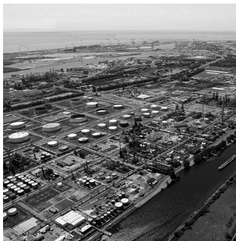
A droite, la plateforme chimique Synerzip (Le Havre, Seine-Maritime).