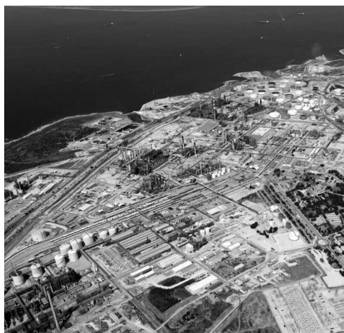
En haut, l'enfer du pôle chimique de Lavéra (Bouches-du-Rhône).

La chimie du charbon, moteur de l'essor industriel, a associé la science, les intérêts industriels et commerciaux et les politiques étatiques dans l'avènement d'un secteur stratégique, la carbochimie. Elle est à la base de la plupart des produits de synthèse. La chimie de charbon connaîtra ses premières débouchées industrielles dans la teinturerie. Le premier colorant de synthèse – la mauvéine – est fabriqué dans les années 1850 par l'action de l'acide sulfurique sur l'aniline tirée du goudron de houille. Ce qui entraîne très vite une pollution du Rhin à grande échelle dès 1863, le long duquel la nouvelle et très puissante chimie industrielle allemande ( Bayer, Hoechst, BASF ) s'est implantée ; en 1875, ses rives accueillent plus de 500 usines, aucun autre fleuve dans le monde n'a jusqu'alors été colonisé à une telle échelle par l'industrie chimique. La gamme des produits synthétiques s'étend alors : nitrocellulose (1846), benzène (1868), celluloid (1870), caoutchouc (1909), ou encore l'azote (procédé Haber-Bosch, 1909-1913), qui ouvre la voie aux engrais chimiques industriels. Dans les années 1900, les États-Unis prennent le