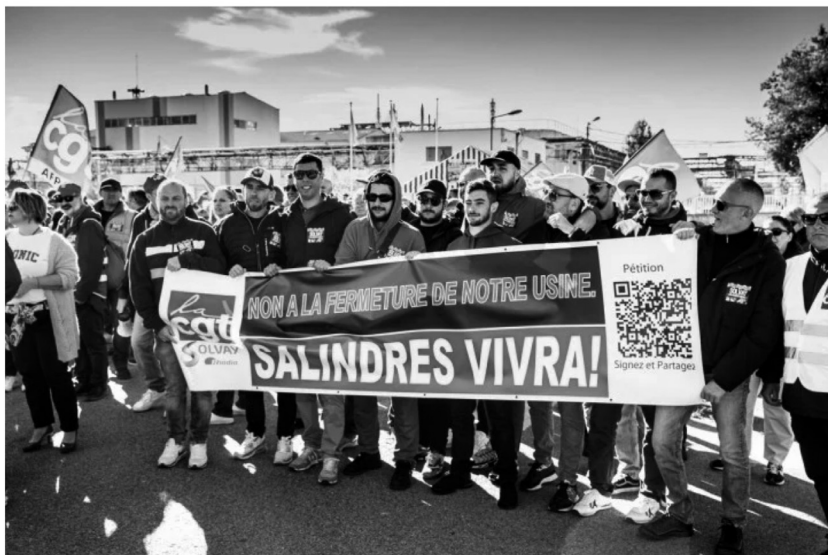
A l'annonce de la possible fermeture de la plate-forme chimique de Salindres (Gard), des ouvriers se mobilisent pour préserver... « notre usine. »

nos élans, nos idées et nos désirs avec la nature, d'en faire des présences reliées à la terre. Dans de nombreuses résistances autochtones, le combat est intrinsèquement relié au « territoire », à la nature (au sens le plus ample) dans laquelle elles s'enracinent et qui les inspire.